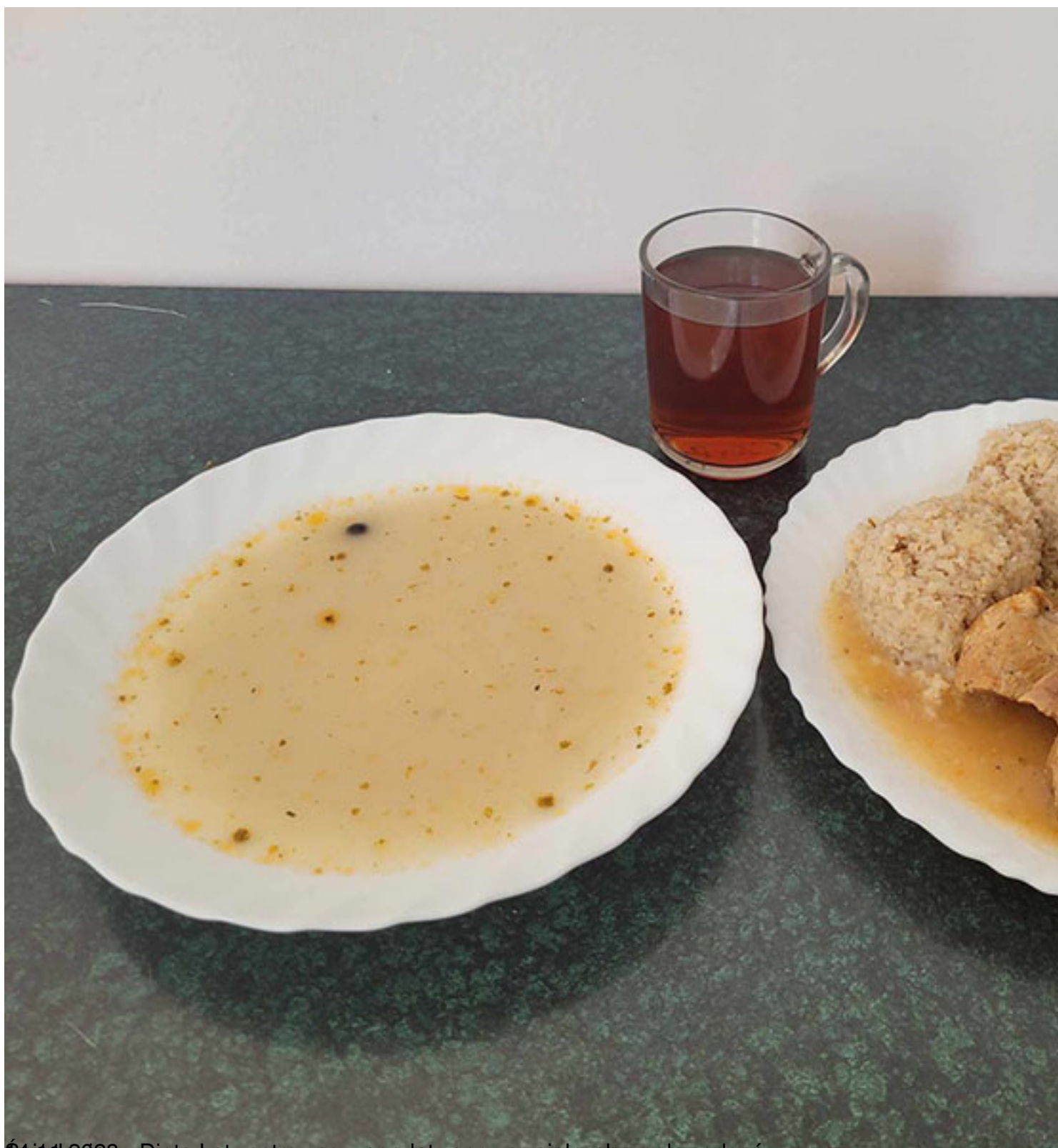
Śniadanie — Dieta Łatwostrawna z ogr. łatwo przyswajalnych węglowodanów